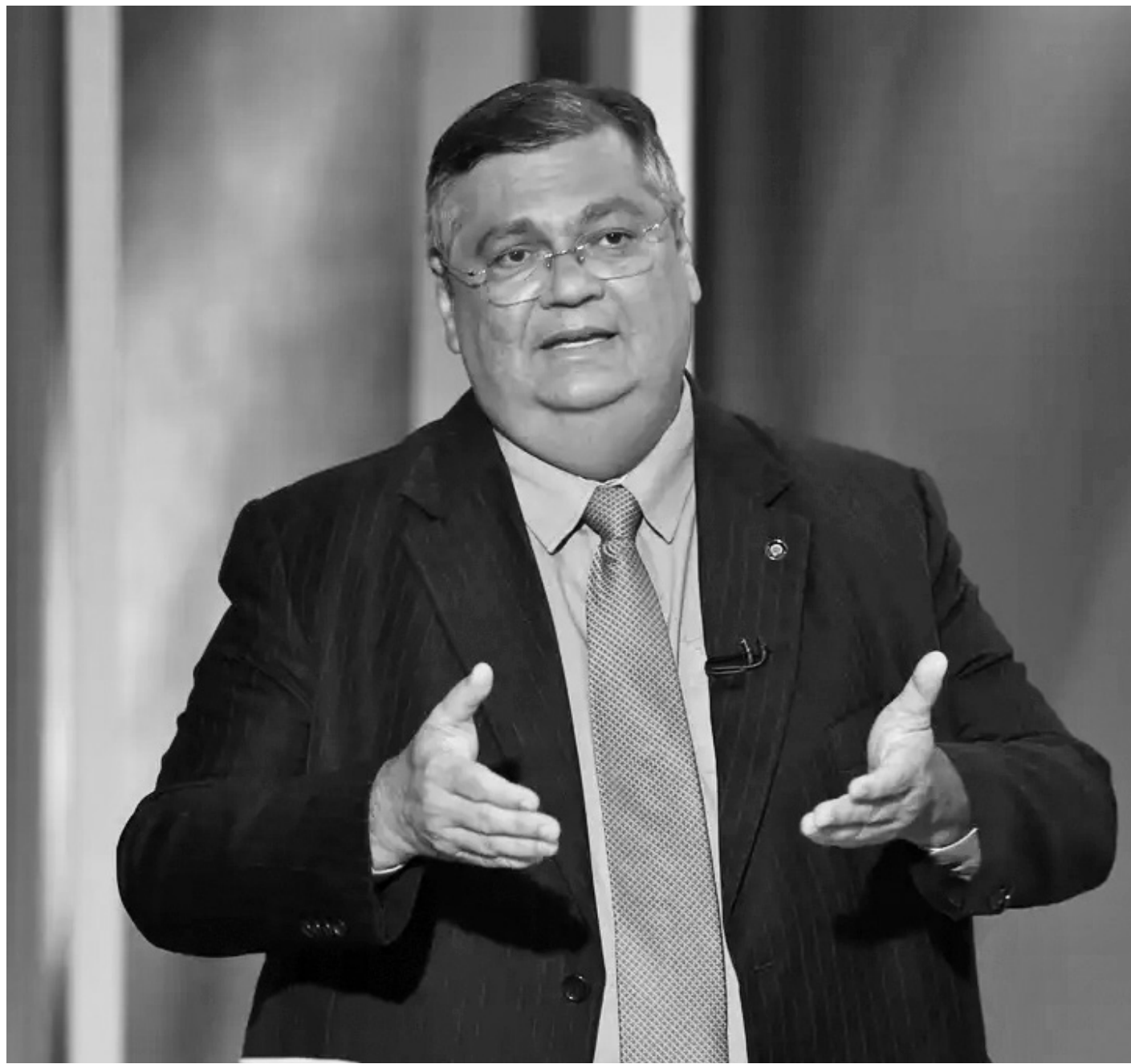
O argumento do ministro foi que o pedido havia sido feito no bojo da ação que analisa, no STF, a validade das emendas

“As evidências apontam para a utilização de verbas em desacordo com seu caráter obrigatório, desvirtuando seu propósito original em favorecimento de interesses políticos e em detrimento do princípio da impessoalidade. A continuidade de tais práticas compromete a eficácia das decisões anteriormente proferidas por este Supremo Tribunal Federal, além de configurar grave violação ao ordenamento jurídico e potencial prejuízo ao interesse público”, sustenta o partido.