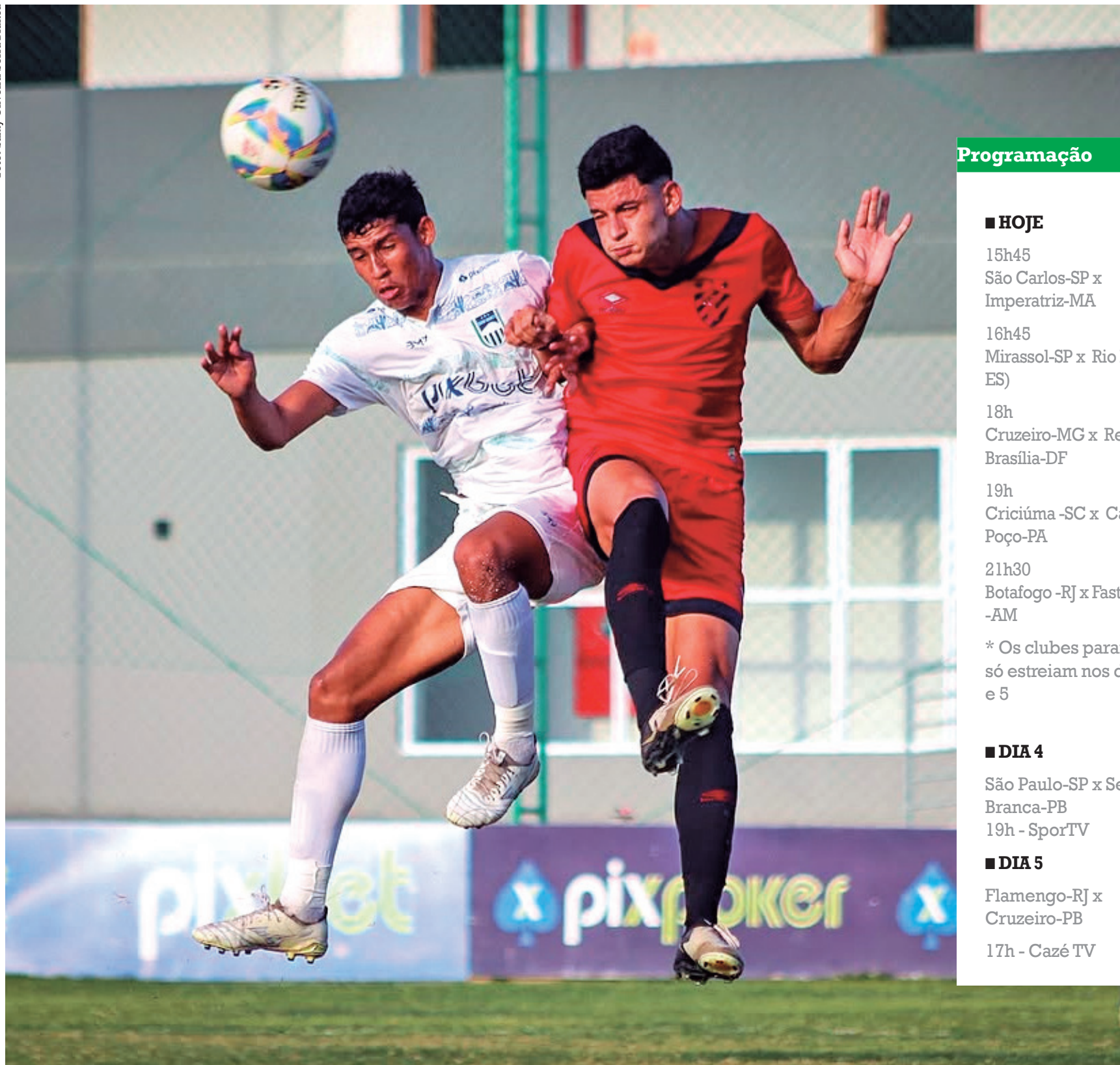
A maior competição de futebol júnior do mundo começa hoje em diversas cidades do estado de São Paulo e vai até o dia 25 deste mês