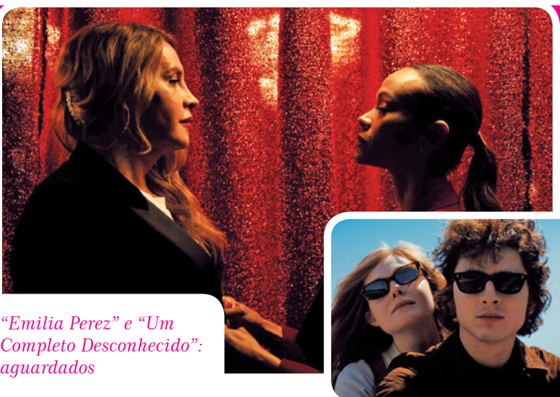
“Emilia Perez” e “Um Completo Desconhecido”: aguardados

Na lista do ano ainda tem o primeiro filme americano, do coreano Bong Joon-Ho, diretor de Parasita : é Mickey 17 , com Robert Pattinson. E o fim do ano ainda terá a segunda parte de Wicked .