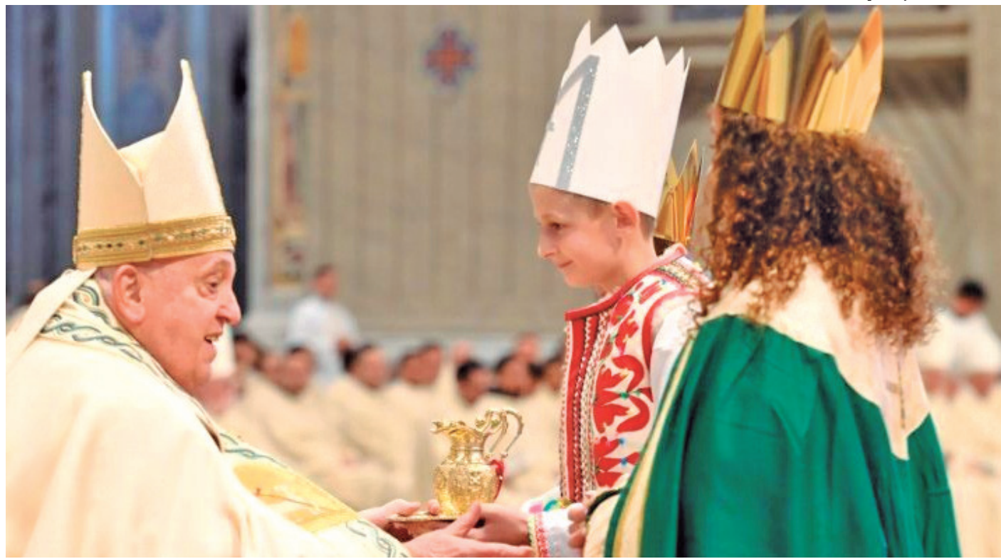
Primeira celebração do pontífice em 2025 foi dedicada a Maria, mãe de Jesus; cerimônia ocorreu na Basílica de São Pedro

■ Líder religioso pediu respeito à vida humana desde a concepção até a morte