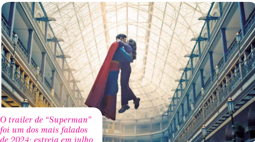
O trailer de “Superman” foi um dos mais falados de 2024: estreia em julho

E não percamos de vista Quarteto Fantástico - Primeiros Passos , a quarta vez em que o cinema tenta entregar uma adaptação ao menos decente à legião de fãs do grupo.