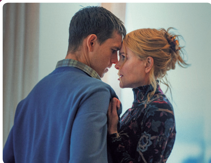
“Conclave”, com Ralph Fiennes (no alto), e “Babygirl”, com Nicole Kidman (acima), são filmes que podem aparecer na lista do Oscar e que estreiam já em janeiro