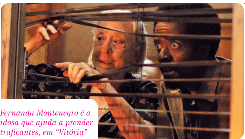
Fernanda Montenegro é a idosa que ajuda a prender traficantes, em “Vitória”

Veja ao lado os demais destaques nacionais.