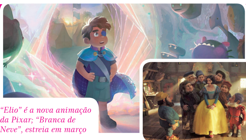
“Elio” é a nova animação da Pixar; “Branca de Neve”, estreia em março

do por Jack Black, estreia a primeira adaptação live-action do jogo homônimo, totalmente estilizada em cenários e ambientações que reproduzem a realidade pixelada dos quadradinhos do game. Confira ao lado os destaques do gênero.