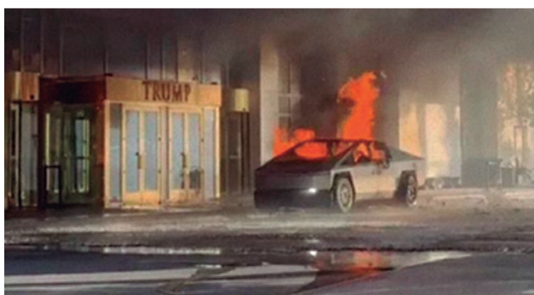
Veículo estava parado em frente ao hotel do presidente eleito dos EUA; uma pessoa morreu